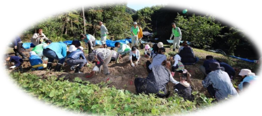
思い思いに さあ開始！