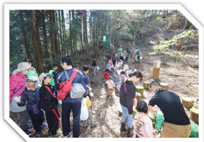
【「ふれあいの森」の森林浴は、最高！】