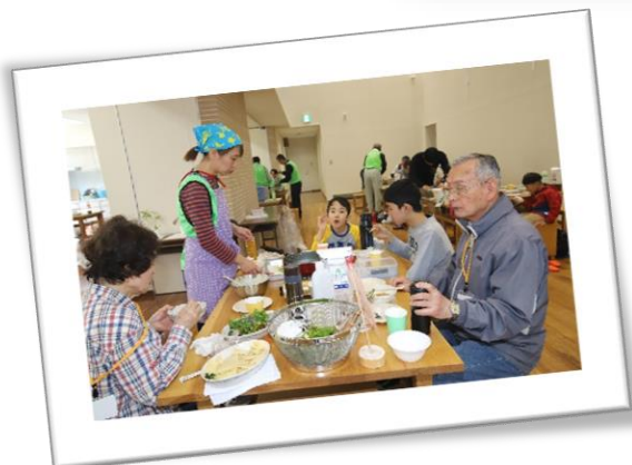
【山菜は美味だなあ！】