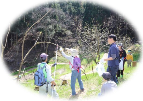
【タラの芽、トゲが痛いよ～！】