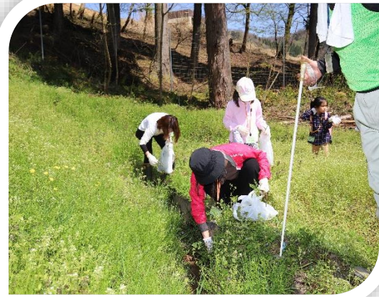
【セリが沢山とれるよ！】