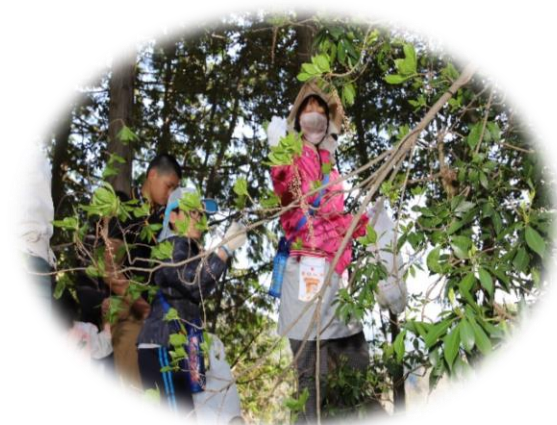
【「リョウブの新芽」おいしそう】